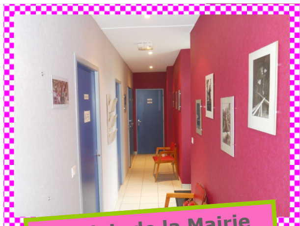
Couloir de la Mairie