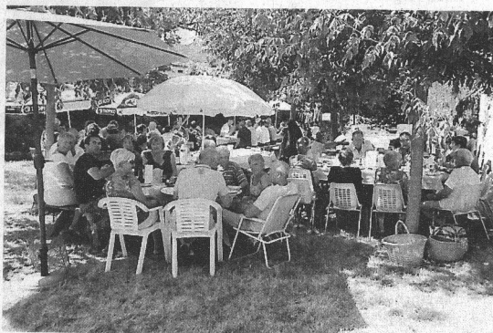
Pique-nique au bord de l'eau