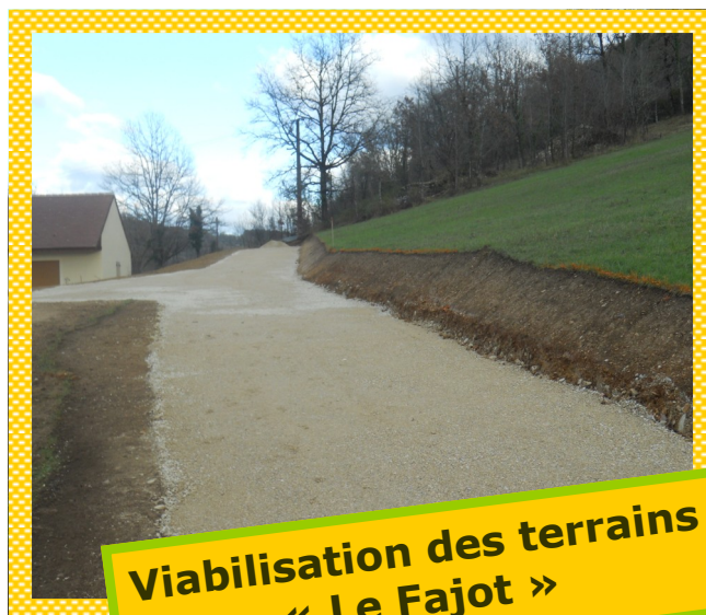
Viabilisation des terrains « Le Fajot »