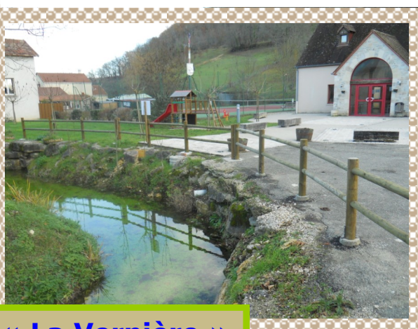
Pose de barrières à « La Vernière » et Place Jacques BOURREE