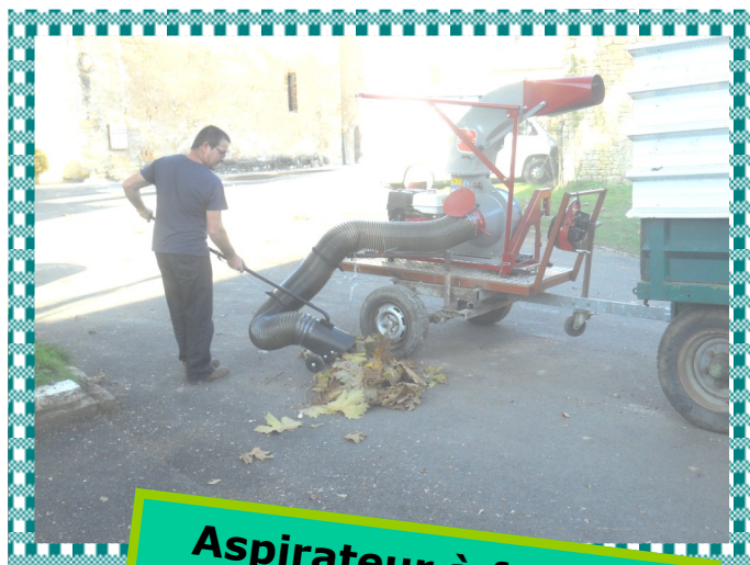
Aspirateur à feuilles